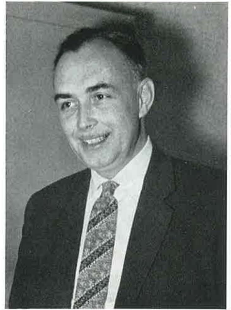
... ons aller gelukwensen ...

Dat de Nijverheidsorganisatie TNO in 25 jaar nu de positie, het aanzien, de betekenis heeft bereikt,